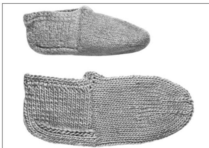
Sur la photo, on voit un chausson avec un talon en trois parties, comme le modèle 6703, avant le feutrage (en bas) et le même chausson terminé après le feutrage (en haut). La différence de taille est évidente.